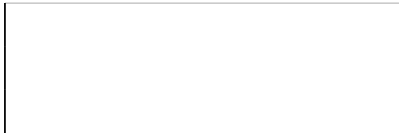
Схема границ эксплуатационной ответственности сторон

Прочие сведения по установлению границ раздела эксплуатационной ответственности сторон _____